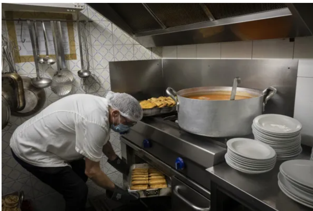
Menjador social La terrasetta, gestionat per l’associació Rauxa. 26.09.2024, Barcelona

“Des de la consideració positiva de la tasca sanitària i social que fa aquest servei, de la seva col·laboració amb programes de formació com el nostre, i del reforç que cal donar sempre a les accions del tercer sector per tal de mantenir l’activació de la iniciativa social en aquests i d’altres temes, agrairíem molt si poguéssiu considerar la formulació d’alternatives que permetin mantenir a curt, a mitjà i llarg termini aquesta iniciativa ”, conclou el professorat.